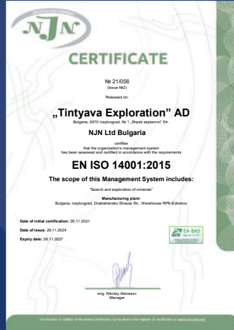
ISO 14001:2015 Çevre Yönetim Sistemi Sertifikası