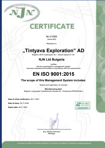
ISO 9001:2015 Kalite Yönetim Sistemi Sertifikası

Bu üç sertifikaya, güvenilirliğimizin ve sürdürülebilirlik odaklı yaklaşımımızın en güçlü kanıtıdır.