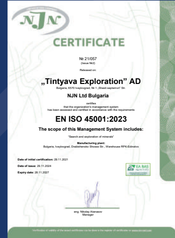
ISO 45001:2023 İş Sağlığı & Güvenliği Yönetim Sistemi Sertifikası